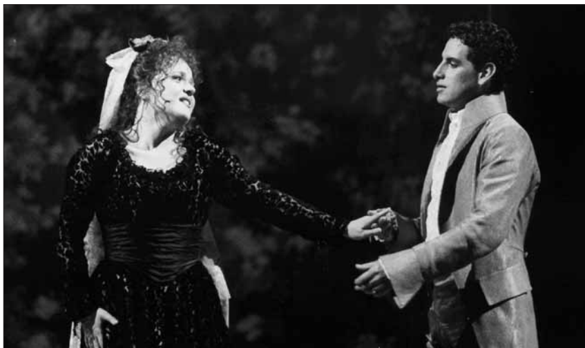
Sonia Ganassi (Rosina) et Juan Diego Flórez (Almaviva), mise en scène d' Alfredo Arias, Teatro alla Scala, Milan, 1999.