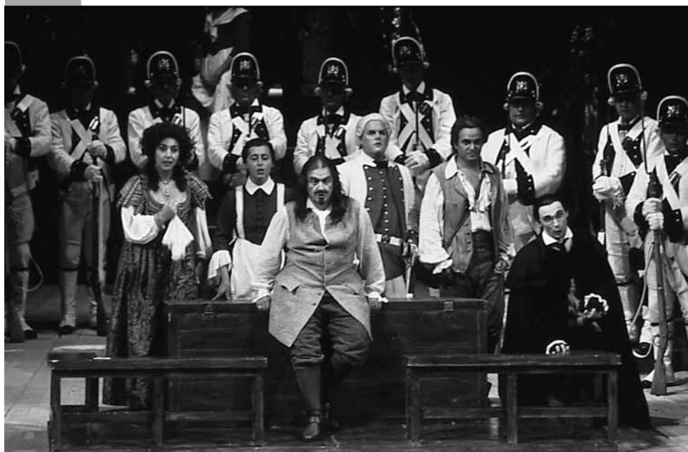
Mise en scène de Luigi Squarzina, Festival Rossini, Pesaro, 1992. Amati-Bacciardi.