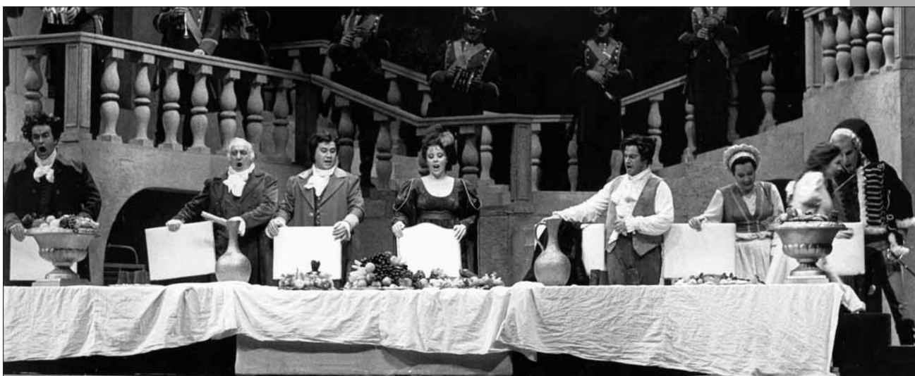
Mise en scène de Dario Fo et Arturo Corso, Opéra d'Amsterdam, 1994. M. Claus.