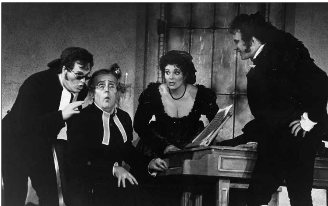
Bruce Ford (Almaviva), Alastair Miles (Basilio), Jennifer Larmore (Rosina) et Dmitri Hvorostovsky (Figaro), mise en scène de John Copley, Opéra de San Francisco, 1996.