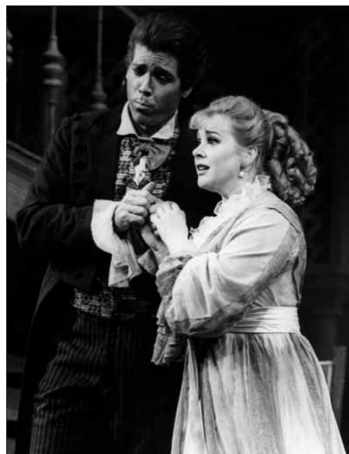
Thomas Hampson (Figaro) et Ruth Ann Swenson (Rosina), mise en scène de John Cox, Metropolitan de New York, 1993.