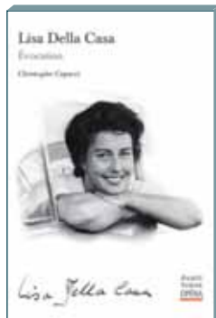
Lisa Della Casa Hors série, mars 2019

Chaque volume de la revue est consacré à un opéra, et propose :