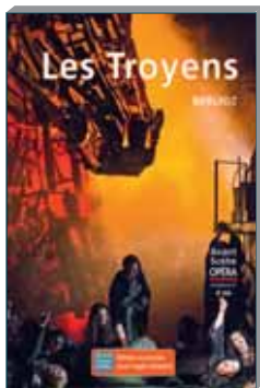
Les Troyens N° 308, janvier 2019