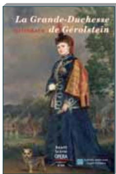
La Grande-Duchesse de Gérolstein N° 309, mars 2019