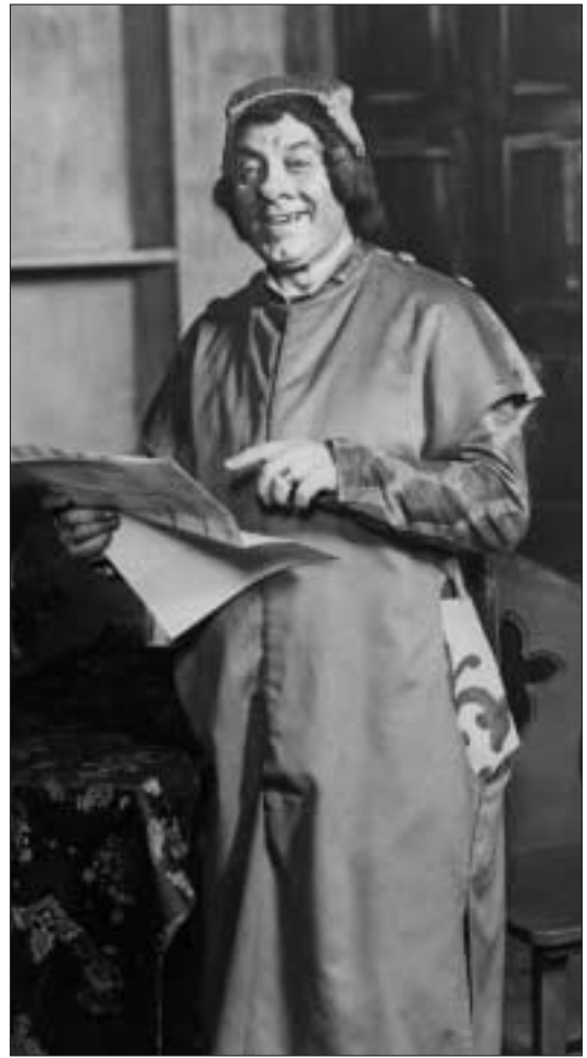
Giuseppe De Luca (Schicchi) lors de la création au Metropolitan de New York, 1918.