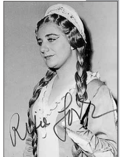
6. Rita Gorr, en 1957. Erlanger de Rosen.