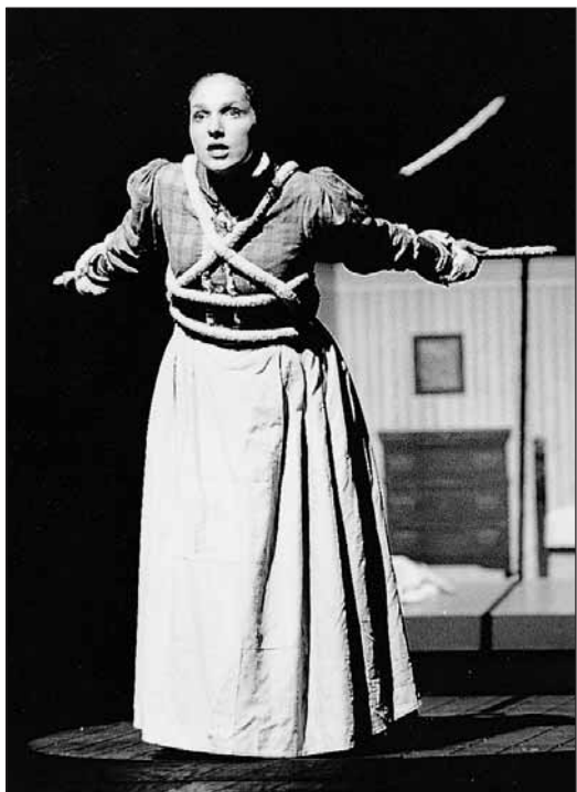
3. Béatrice Uria-Monzon, Marguerite au Festival de Bregenz en 1992.