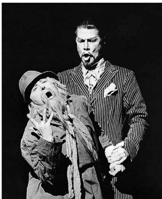
Ci-dessus : Jerry Hadley (Faust) et Samuel Ramey (Méphistophélès) à Londres en 1993.